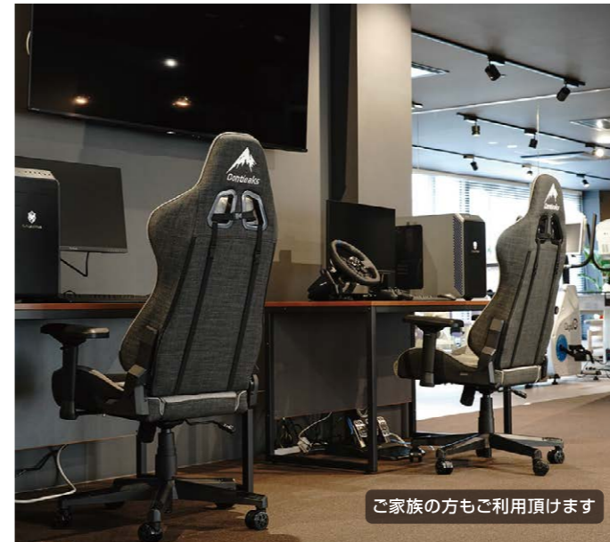
ご家族の方もご利用頂けます

コンピューターゲームやVRを通じたe-sportsは、リハビリの枠を超えて、患者様に新しい挑戦と達成感をもたらします。実際にご利用された中には、職員より上手な方もいて驚きました。これは何?やってもいい?明日もやりたいと。昔みんなとドライブに行った思い出を語ってくれたり、楽しみながら体幹、下肢トレーニングなど機能改善にもなります。