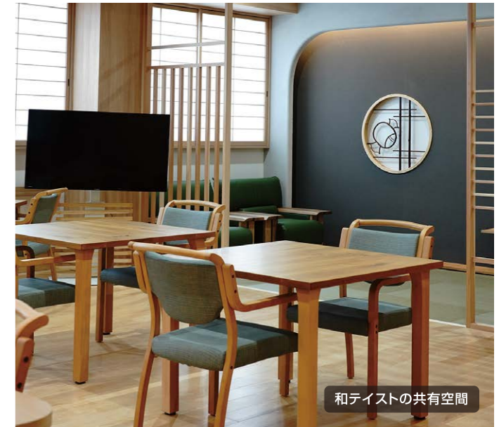
和テイストの共有空間

コンピューターゲームやVRを通じたe-sportsは、リハビリの枠を超えて、患者様に新しい挑戦と達成感をもたらします。実際にご利用された中には、職員より上手な方もいて驚きました。これは何?やってもいい?明日もやりたいと。昔みんなとドライブに行った思い出を語ってくれたり、楽しみながら体幹、下肢トレーニングなど機能改善にもなります。