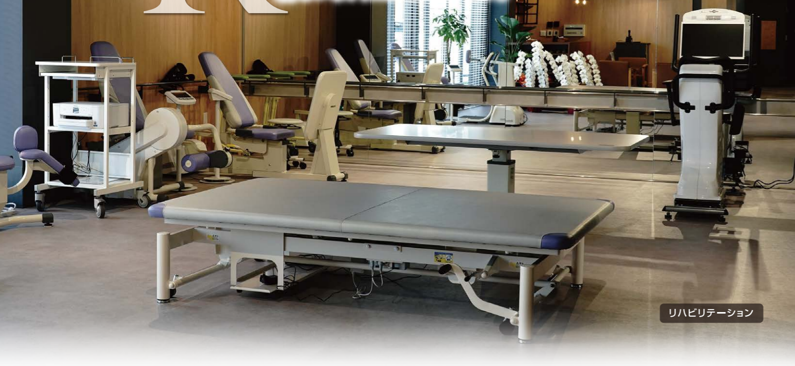
リハビリテーション

選べるリハビリ。無理なく、自主的に、 運動リハと脳科学リハの両面から改善を目指す 新しいリハビリのスタイル。