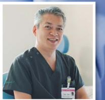
医療法人あじさい会 あじさい内視鏡クリニック