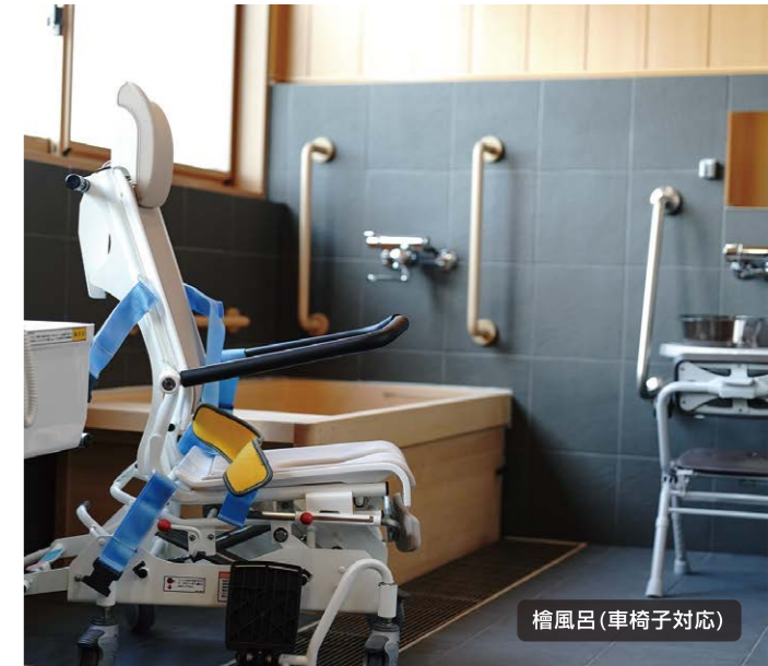
檜風呂(車椅子対応)

共有ダイニングスペースでは、ゆったりと寛ぎながら、美しい景色を眺めることができ日本の風情を感じながら、他の入居者との交流や大切なひとときをお楽しみいただけます。そして、心地よい和のデザインを活かした空間と、広々としたキッチンスペースもご用意し、ここでは、調理することもでき、美味しい食事を作りながら、コミュニケーションの場としてもご利用いただけます。