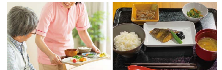
▲ご入居者様の状態に合わせたお食事をご提供します

管理栄養士による通常食の提供のほか、治療食の対応もしており、栄養価の高い嚥下調整食の提供をいたします。おいしくて栄養バランスのとれた献立を毎月計画し、食欲をそそり、食べ残しを抑制するだけでなく、厚生労働省の食事摂取基準をもとにメニューを作成しているので栄養面も安心です。