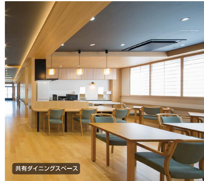
共有ダイニングスペース

共有ダイニングスペースでは、ゆったりと寛ぎながら、美しい景色を眺めることができ日本の風情を感じながら、他の入居者との交流や大切なひとときをお楽しみいただけます。そして、心地よい和のデザインを活かした空間と、広々としたキッチンスペースもご用意し、ここでは、調理することもでき、美味しい食事を作りながら、コミュニケーションの場としてもご利用いただけます。