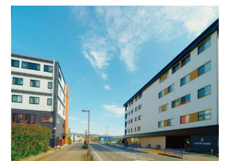
▲サウスマーク(右)に隣接する建物がサウスポート(左)