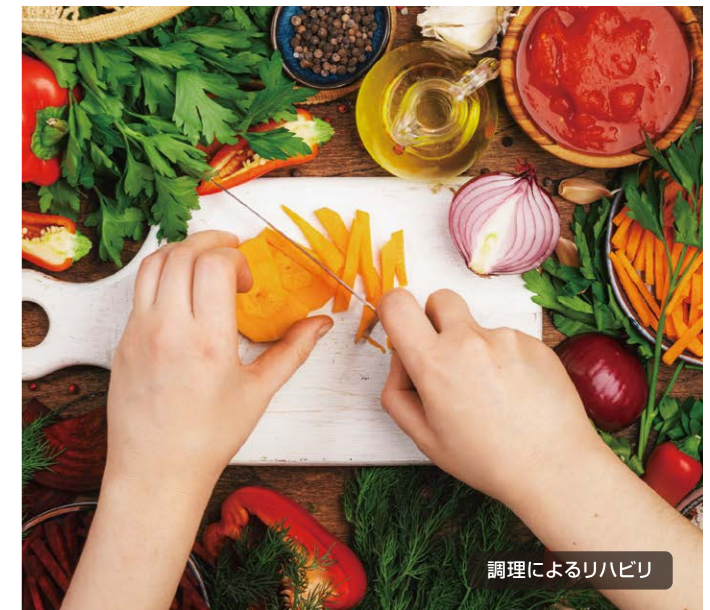
調理によるリハビリ

リハビリテーションプランには、身体的基本的な機能や筋力の向上を促進するエクササイズが含まれます。また、日常生活動作のトレーニングも行い、入居者が自宅での独立した生活に必要なスキルを身につけます。我々のスタッフは入居者一人ひとりに寄り添い、モチベーションを高めながらリハビリを進めます。コミュニケーションやご家族様との結びつきも大切に、入居者が愛される環境で心身ともに回復できるよう努めています。