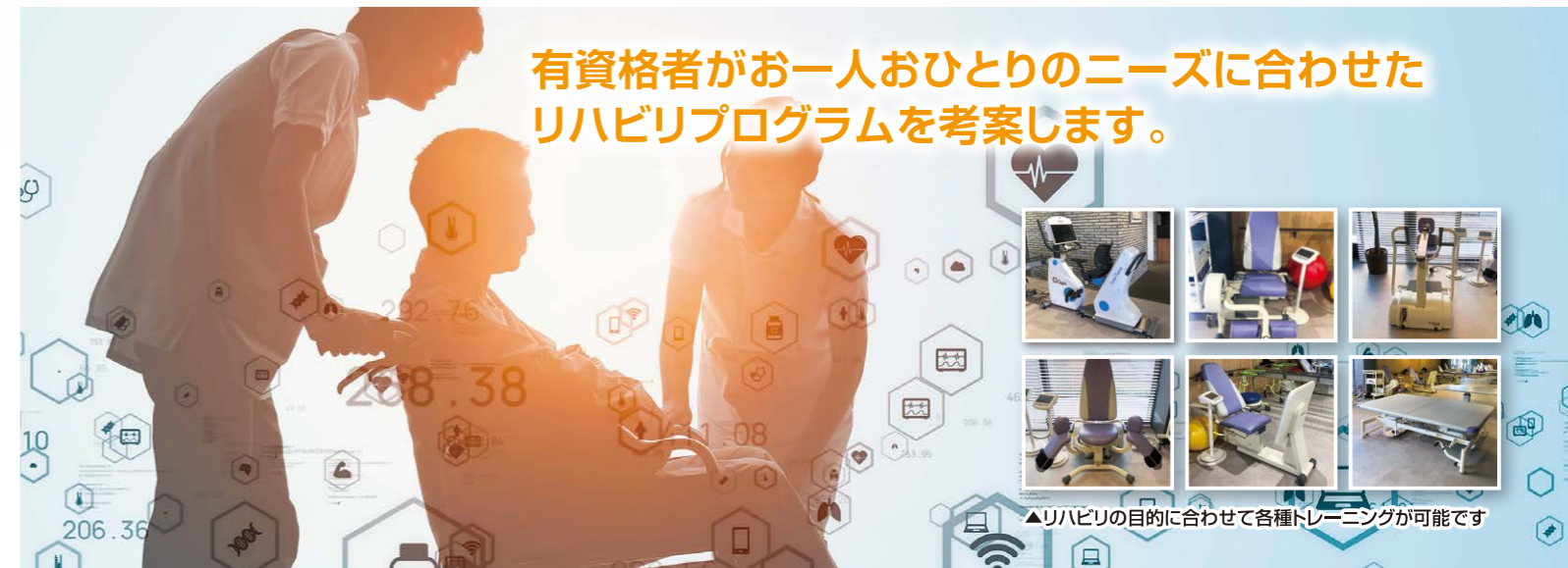
▲リハビリの目的に合わせて各種トレーニングが可能です

「リハビリテーション」と「生きがい」を重視し、お客様に充実した生活を送っていただきたい